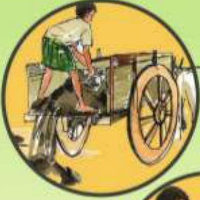
చెరువు మట్టి చల్లడం