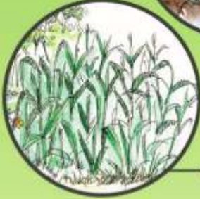
పొలంలో పచ్చి రొట్టె ఎరువు సాగు