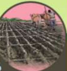
పొలాలలో నీటి కుంటలు (ఫార్మ్ పాండ్)