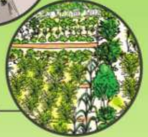
వైవిధ్య పంటల సాగు