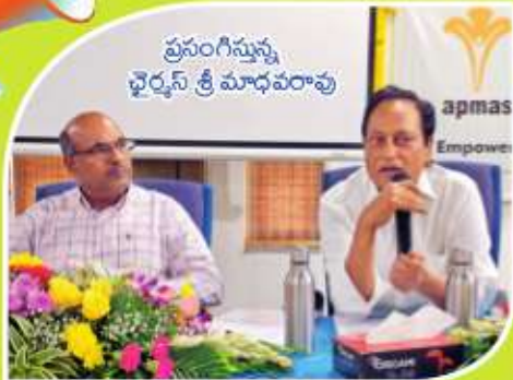
ప్రసంగిస్తున్న ఛైర్మన్ శ్రీ మాధవరావు