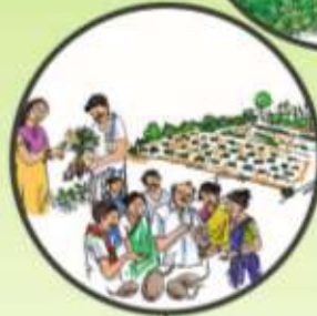
నాణ్యమైన విత్తనాల వాడకం