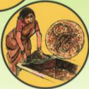
జీవ ఎరువుల వాడకం