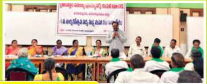
పామిడి ఎఫ్ పి సి , రైతుసేవ్ ఎఫ్ పి సి వార్షిక మహాసభల దృశ్యాలు