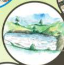
చిన్న చిన్న తూట కుంటలు