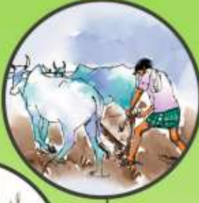
లోతుగా దుక్కులు దున్నడం