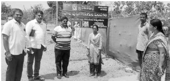
సిడ్డీ, ఏపిమాస్ సిబ్బందితో లత

“ఇంతటి మంచి అవకాశం కల్పించిన సిడ్డీ, ఏపిమాస్ సిబ్బందికి నా కృతజ్ఞతలు. ఈరోజు నాకు చాల గర్వంగా ఉంది. దినసరి కూలీగా జీవనం సాగించే అతి నిరుపేద గిరిజన మహిళను, పుట్టగొడుగుల పెంపకం సాగిస్తూ, వాటితో వ్యాపారం చేస్తున్నాను అంటే ఇప్పటికీ నమ్మశక్యంగా లేదు. నా కుటుంబ ఆదాయం పెరగడమే కాకుండా, నేను ఒక వ్యాపారవేత్తగా ఎదగడానికి కూడా ఇది తొలి అడుగు. రాబోయే రోజుల్లో పెద్దఎత్తున పుట్టగొడుగుల తయారు చేయడానికి నాలుగు గదులతో షెడ్ నిర్మిస్తున్నాము. అందులో మంచి వ్యాపారము జరుగుతుందని పూర్తి నమ్మకం ఉంది”.