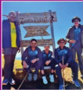
నందాదేవి హిమగిరిపై సి ఎస్ బృందం

జివ్ ... 2025 జాతీయ ఉత్తమ స్వయంసహాయ సమాఖ్యలు!