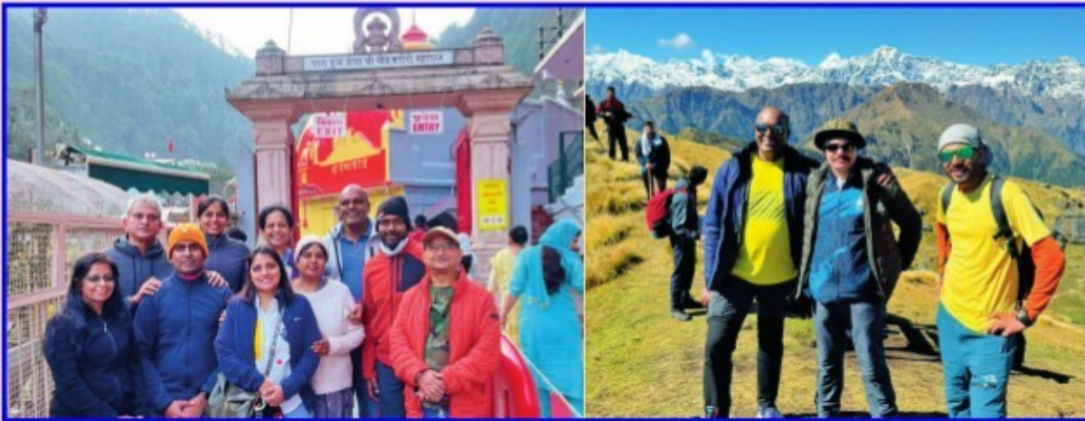
నందా దేవి పర్వతారోహణలో సి ఎస్ బృందం ..... మరి కొన్ని దృశ్యాలు