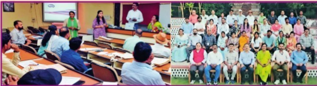
ఎఫ్ పి ఓలలో లైంగిక సమతుల్యతపై మధ్యప్రదేశ్ రాజధాని భోపాల్లో ఏపిమాన్ శిక్షణ