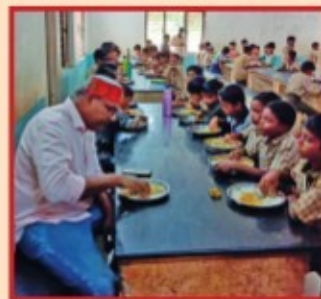
విద్యార్థులతో సి ఎస్ సహభోజనం

బట్వాడా కాకపోతే దయచేసి ఈ చిరునామాకు తిప్పింపండి ఎడిటర్, మహిళా సాధికారత, ఏపిమాన్ కార్యాలయం, పోస్ట్ నెం.11-12, ముదా కాలని, తానీషానగర్, డ్రీమ్స్ వ్యాలీ దగ్గర, మణికోండ, రంగారెడ్డి జిల్లా, హైదరాబాదు-500089