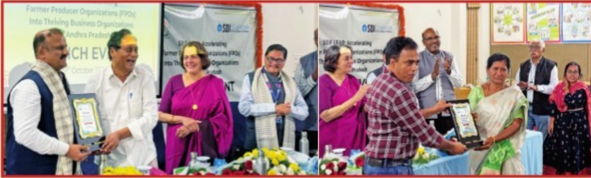
'ఎఫ్ పి ఓల వ్యాపార వేగవంతం' ప్రాజెక్ట్ ప్రారంభం ..... మరి కొన్ని దృశ్యాలు