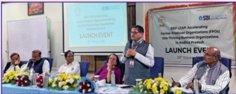
'ఎఫ్ పి ఓల వ్యాపార వేగవంతం' ప్రాజెక్ట్ ప్రారంభ దృశ్యం