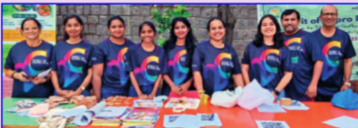
విప్రో రన్ కు సహకారం అందించిన ఏపిమాన్ బృందంలో కొందరు