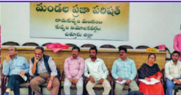
వి4 ప్రాజెక్ట్ లో భాగంగా రామకుప్పం మండలంలో బంగారు కుటుంబాలతో ఏపిమాన్, ఎం ఇ ఐ ఎల్ బృందాల చర్చలు