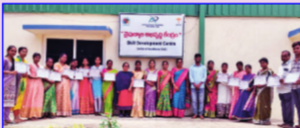
గోరంట్లపల్లిలో నైపుణ్య శిక్షణ పొందిన అభ్యర్థులు