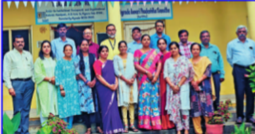
కర్ణాటకలో శిక్షణ పొందిన ఏపిమాన్ బృందం

బట్వాడా కాకపోతే దయచేసి ఎడిటర్, మహిళా సాధికారత, ఏపిమాన్ కార్యాలయం, పొట్ల నెం.11-12, హుదా కాలనీ, తానీషాగర్, డ్రీమ్ వ్యాలీ దగ్గర, మణికోండ, రంగారెడ్డి జిల్లా, హైదరాబాద్-500089 ఈ చిరునామాకు తిప్పివ్వండి