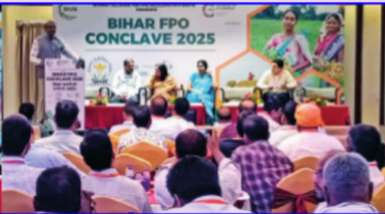
బీహార్ లో ఎఫ్ పి ఓల మహాసమ్మేళనం ... మలికొన్ని దృశ్యాలు