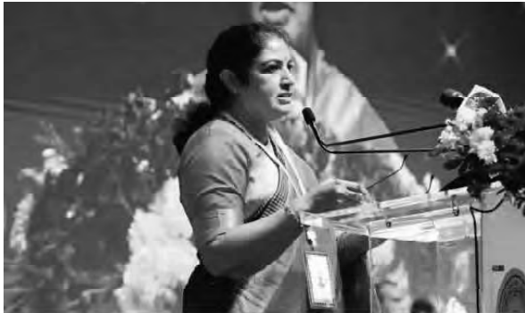
మాట్లాడుతున్న పార్లమెంట్ కమిటీ (మహిళా సాధికారత) చైర్పర్సన్ పురందేశ్వరి

దేశంలో తొలిసారిగా మధ్యప్రదేశ్ అసెంబ్లీ మహిళా సాధికారతపై కమిటీ ఏర్పాటు చేసిందని తద్వారా మహిళా