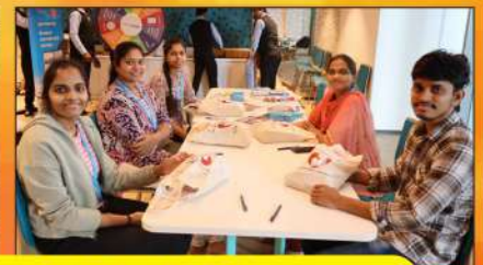
పాలిచ్చే తల్లులకోసం 'మాతా శిశు సంరక్షణ కిట్స్' సిద్ధంచేస్తున్న విప్రో సిబ్బంది, ఏపిమాస్ ప్రతినిధులు