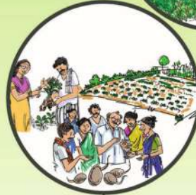
నాణ్యమైన విత్తనాల వాడకం