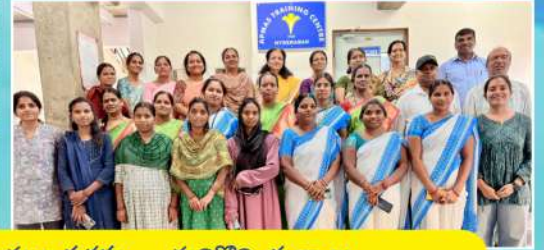
మాతాశిశు సమగ్ర పోషణపై ఏపిమాస్ ఆధ్వర్యంలో భాగస్వాముల సదస్సు ... మరికొన్ని దృశ్యాలు