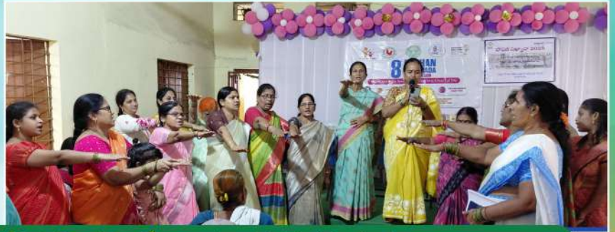
పోషణ పఖ్వాదాపై ఏపిమాస్ ఆధ్వర్యంలో విద్యార్థినుల ప్రదర్శన, మహిళల ప్రతిజ్ఞ