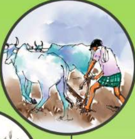
లోతుగా దుక్కులు దున్నడం