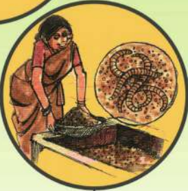
జీవ ఎరువుల వాడకం