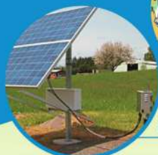
సోలార్ పంపుసెట్ల ఏర్పాటు