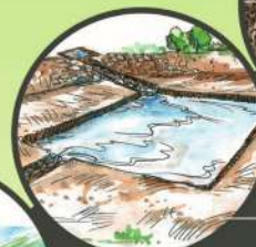
పొలాలలో నీటి కుంటలు (ఫార్మ్ పాండ్)