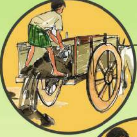
చెరువు మట్టి చల్లడం