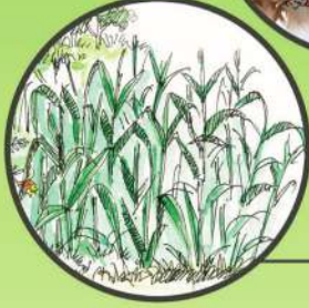
పొలంలో పచ్చి రొట్టె ఎరువు సాగు