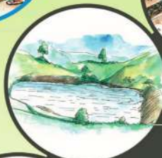
చిన్న చిన్న ఊట కుంటలు