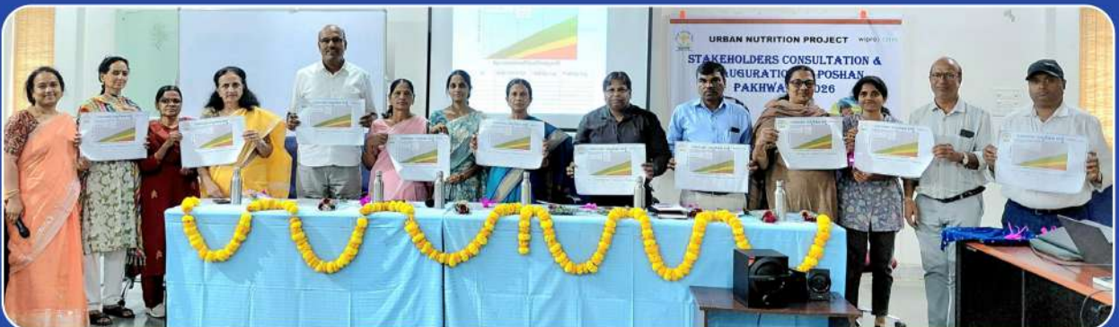
మాతాశిశు సమగ్ర పోషణపై ఏపిమాస్ ఆధ్వర్యంలో భాగస్వాముల సదస్సు .. పిల్లల పెరుగుదల పర్యవేక్షణ ఛార్ట్ ఆవిష్కరణ